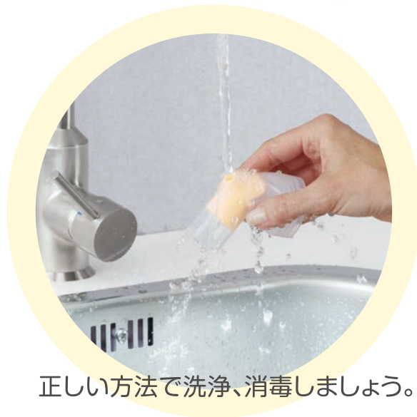
正しい方法で洗浄、消毒しましょう。