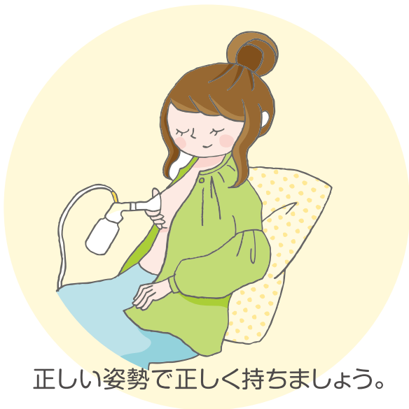
正しい姿勢で正しく持ちましょう。